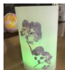
<押し花の ランプシェード>